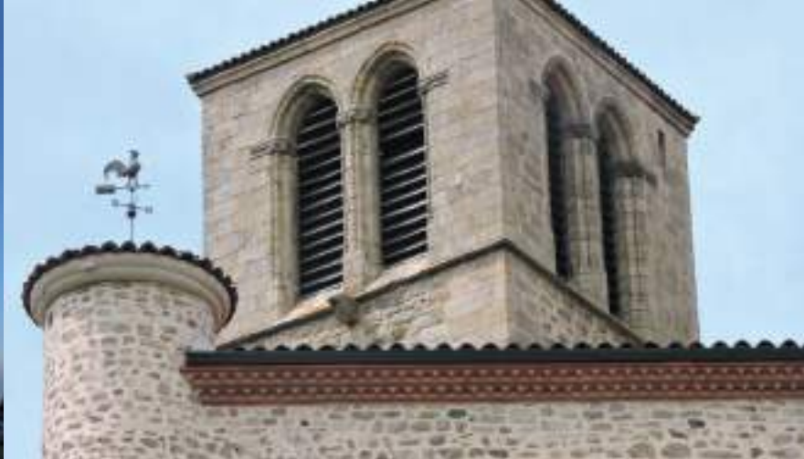
Un aperçu de la silhouette élégante du bourg de Roche-en-Forez