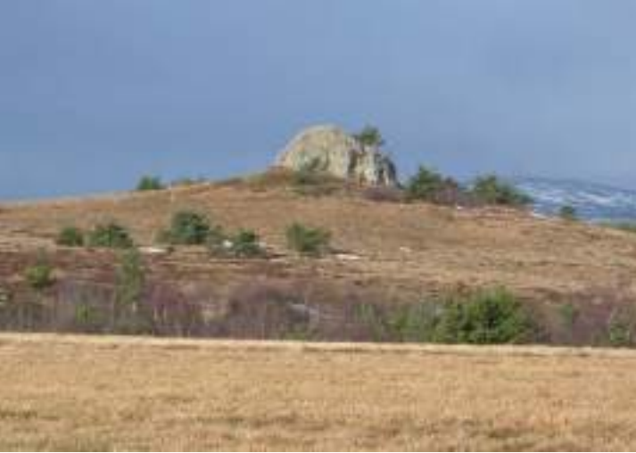
La Grande Pierre Bazanne sert de repère aux randonneurs et offre un large panorama sur un plateau aux allures de steppe