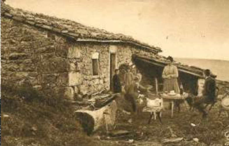
Carte postale ancienne : jasserie à Pierre-sur-Haute, fin du 19 e siècle