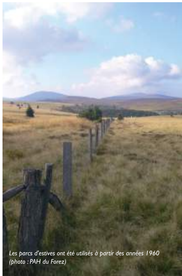
Les parcs d'estives ont été utilisés à partir des années 1960

droite avec une brutalité presque douloureuse, entraînant un gonflement réactionnel de la joue gauche qui s'accroissait lorsque le souffle d'Eole pénétrait par ma bouche entrouverte pour me gonfler comme un ballon ». Heureusement, de belles journées permettent de découvrir les Hautes Chaumes sous un jour plus favorable. Au début du 20e siècle, un organisateur montbrisonnais d'excursions estivales sur la montagne, en voiture hippomobile, vendait déjà les vertus des Hautes Chaumes en ces termes : « Monter à Pierre-sur-Haute, c'est aérer son esprit, rafraîchir ses bronches des senteurs parfumées du printemps, faire provision de santé et d'énergie ». Avis aux amateurs !