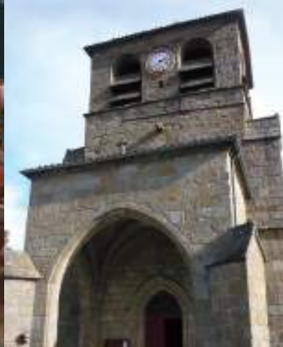
L'église gothique de Gumières et son porche précédant l'entrée