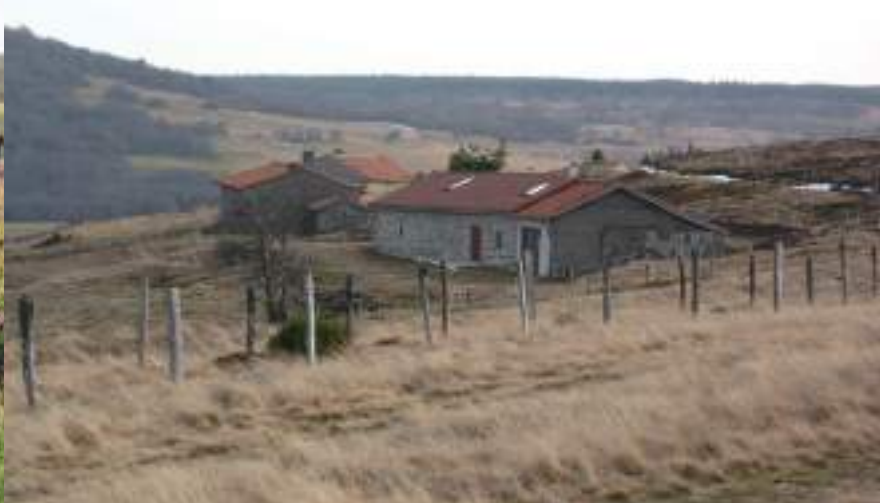
Les jasseries de Garnier dans un paysage automnal