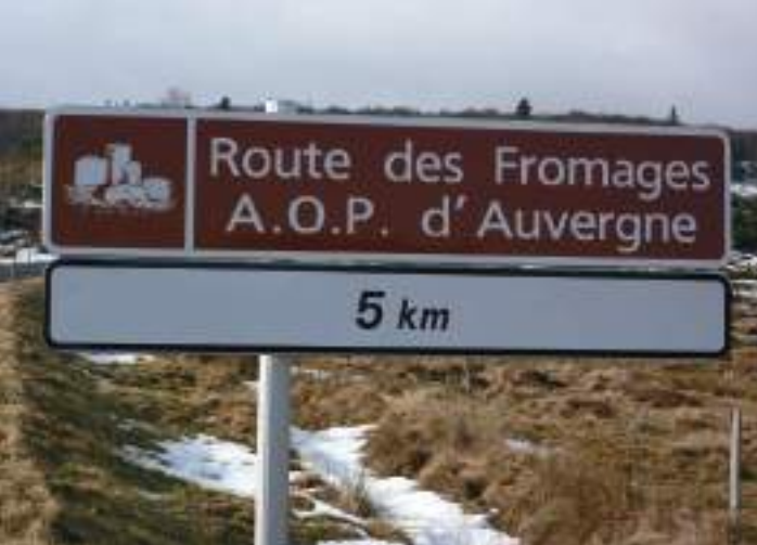
La Route des Fromages d'Auvergne vous guide chez les producteurs du Puy-de-Dôme