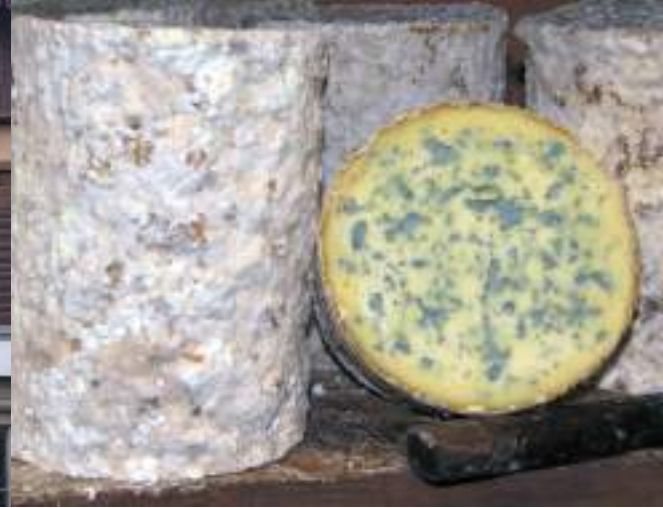
La fourme d'Ambert