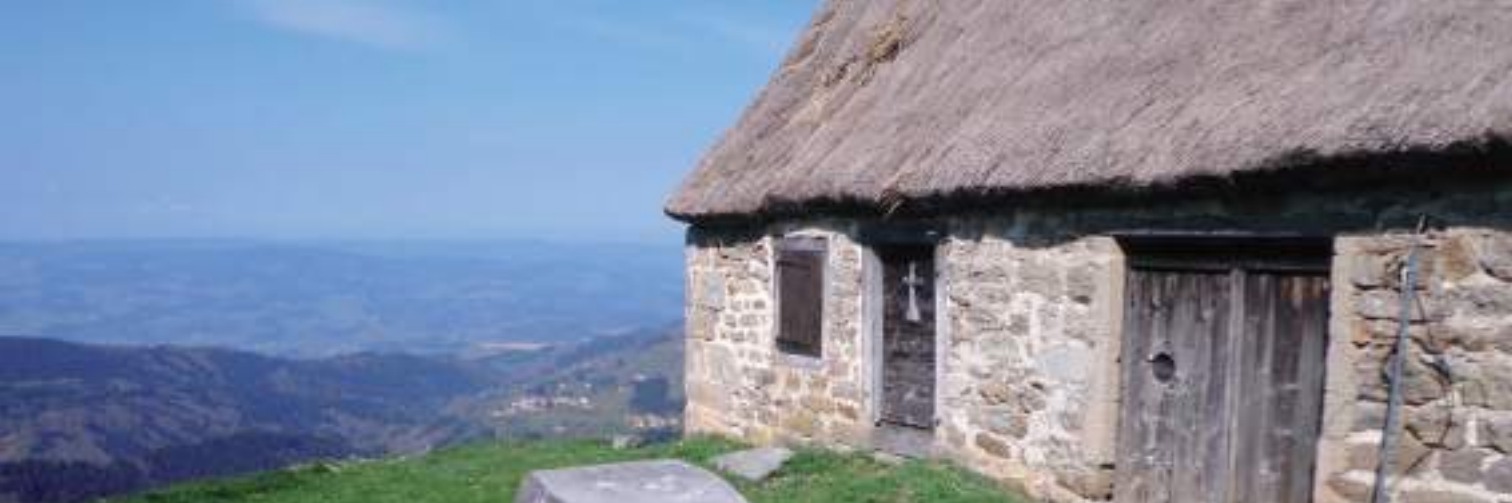
Depuis les jasseries des Supeyres s'ouvre un panorama sur les monts du Livradois et, en arrière-plan, sur la chaîne des Domes