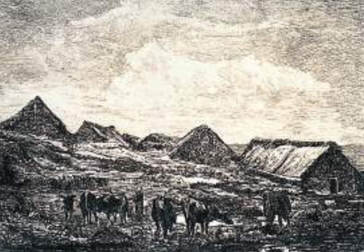
Les Jasseries de Colleigne. Dessin extrait de Félix Thiollier, Le Forez Pittoresque et Monumental , 1889