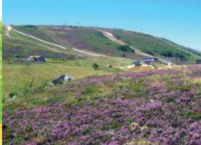
En été, les callunes en fleur parent les reliefs des Hautes Chaumes d'une couleur pourpre