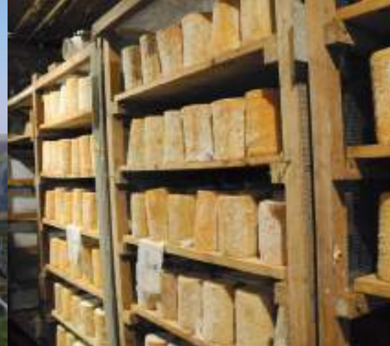
Une cave d'affinage de fourmes de Montbrison