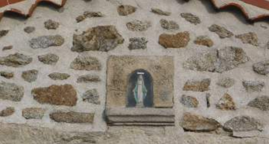
Niche abritant une statue de la Vierge sur le mur pignon de la jasserie des Planches