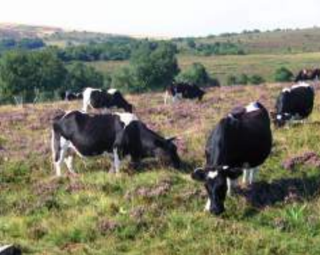
Troupeau de vaches laitières