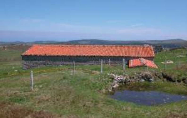
Une jasserie, à Colleigne : en premier plan, le réservoir d'eau appelé serve ou bonde, placé au-dessus de la cave à fourme accolée à la jasserie