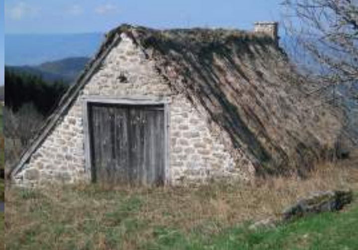
Les jasseries du col des Supeyres sont couvertes d'une toiture en chaumes. Le fenil, situé au-dessus de l'étable, est accessible de plain-pied