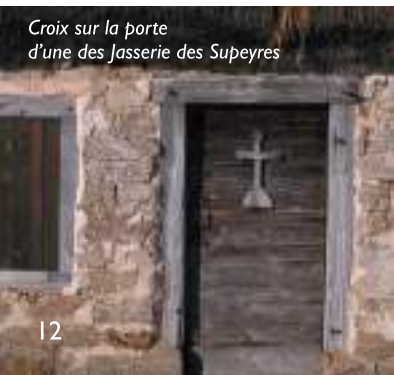
Croix sur la porte d'une des jasserie des Supeyres

Il n'est pas rare de voir, sur les jasseries, des signes de protection que le paysan plaçait pour conjurer le mauvais sort, accroître sa force de travail ainsi que la santé des hommes et du bétail. Les croix, plus ou moins grandes et démonstratives, les statues de la Vierge abritées dans une niche, le fer à cheval... sont autant de signes qui renvoient à des rites privés en témoignant de croyances populaires anciennes.