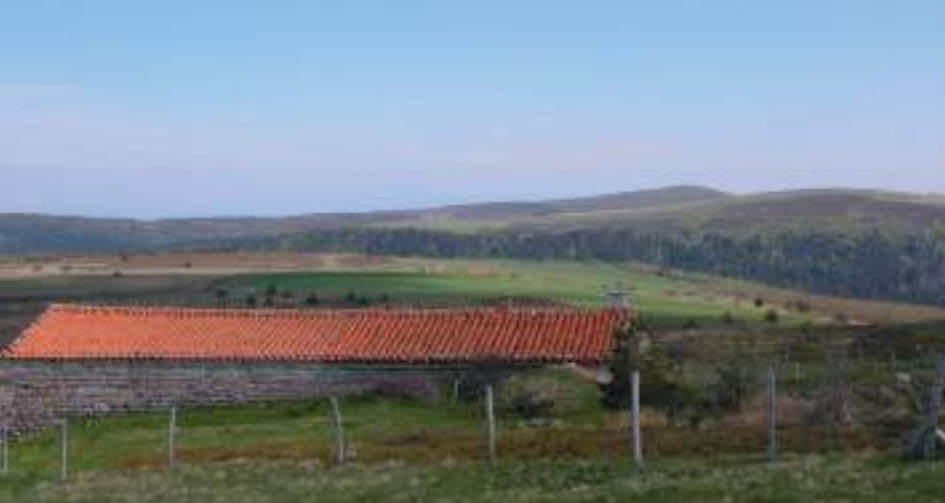
Les Hautes Chaumes depuis les jasseries de Colleigne