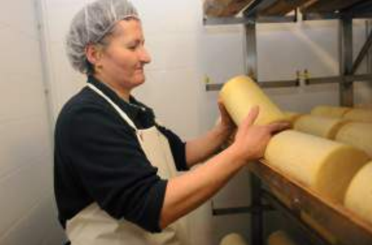
Fromagerie artisanale