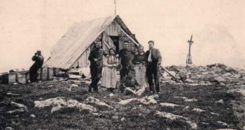
La première station de télégraphie optique, installée dans une simple cabane