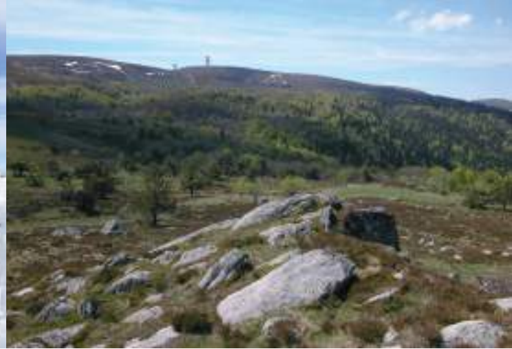
Les blocs granitiques, résultats de l'érosion glaciaire