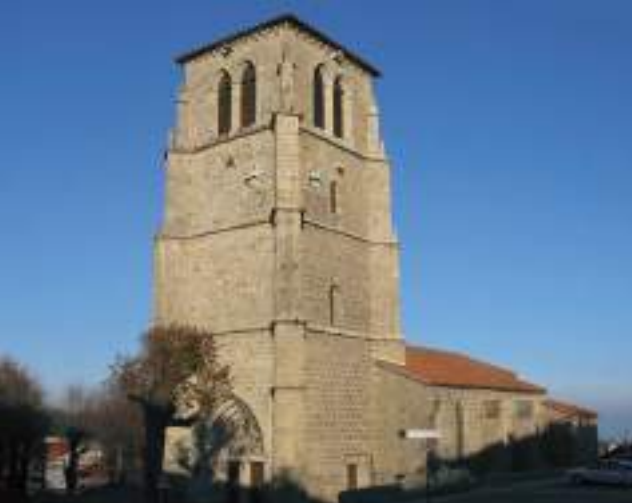
L'église de Verrières a été édifée par les Comtes de Forez à la frontière de l'Auvergne