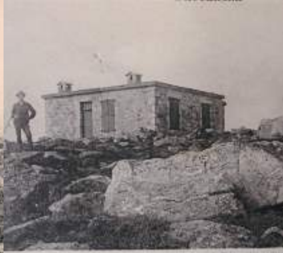
La station de télégraphie reconstruite en 1920