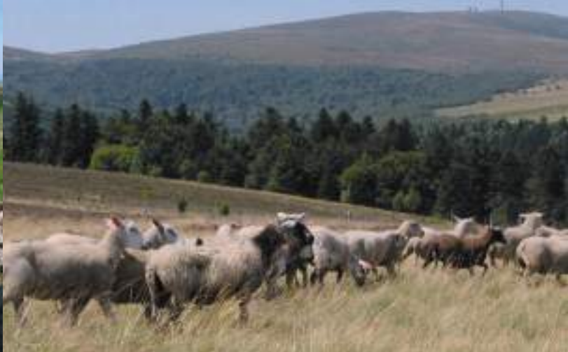
Interdit de pâture au Moyen Âge, le mouton est désormais très présent dans le paysage. Une fête lui est dédiée tous les mois de juillet à Garnier

de débouchés commerciaux dû à la faiblesse de l'action commerciale, les limites de la production familiale elle-même incapable de répondre tout à fait à la demande, les problèmes de conservation de la fourme sur des transports longs, amorcent le déclin. Personne ne veut plus monter à l'estive, dans des conditions d'inconfort qui rebutent tout le monde. Les guerres, l'exode rural, le vieillissement de la population agricole, accélèrent l'abandon de la montagne et du système d'exploitation traditionnel. L'air du temps sera bientôt à la performance commerciale, à l'intensification des productions, à la concurrence. La fabrication de la fourme et des produits laitiers deviennent l'affaire des grandes laiteries des villages bas, d'abord familiales, rachetées ensuite dans le dernier tiers du 20e siècle par des grands groupes.