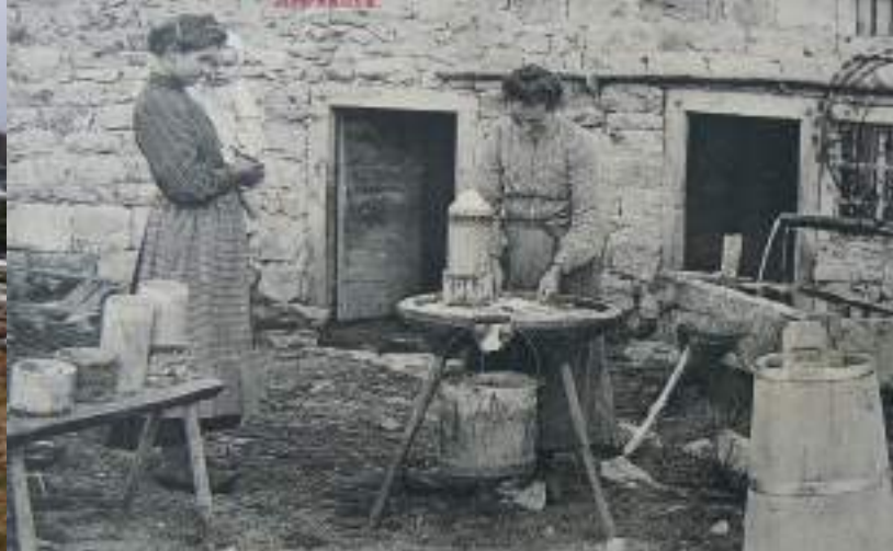
Cette carte postale ancienne illustre une scène ordinaire de la fabrication familiale de la fourme en jasserie.