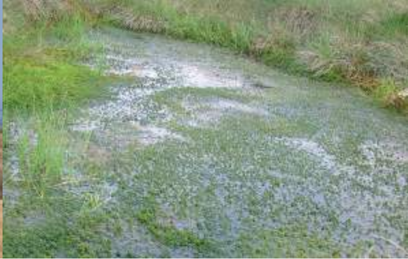
Une tourbière est une zone humide colonisée par la végétation dont le sol est saturé en permanence par une eau stagnante ou très peu mobile