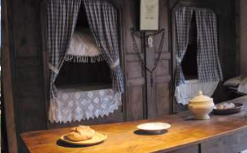
Musée de la Fourme et des Traditions à Sauvain