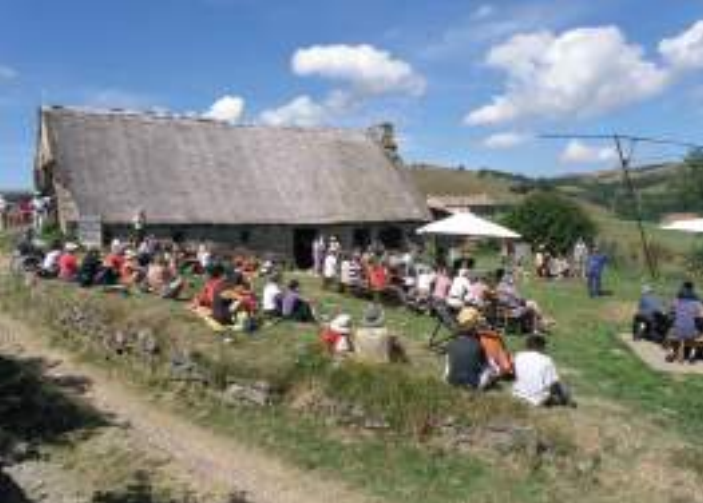
Jasserie du Coq Noir