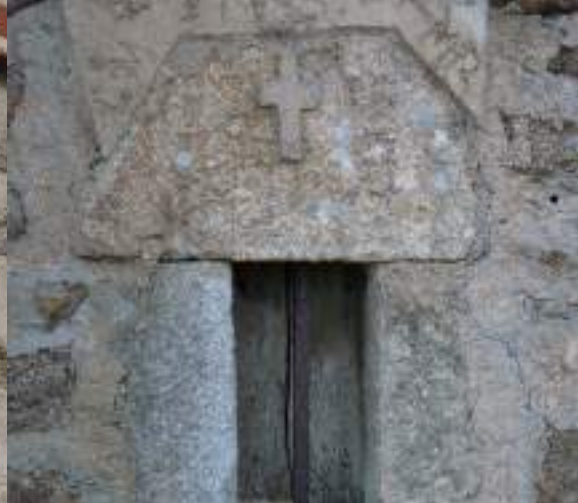
Une croix sur le mur pignon d'une cave à fourme à Garnier