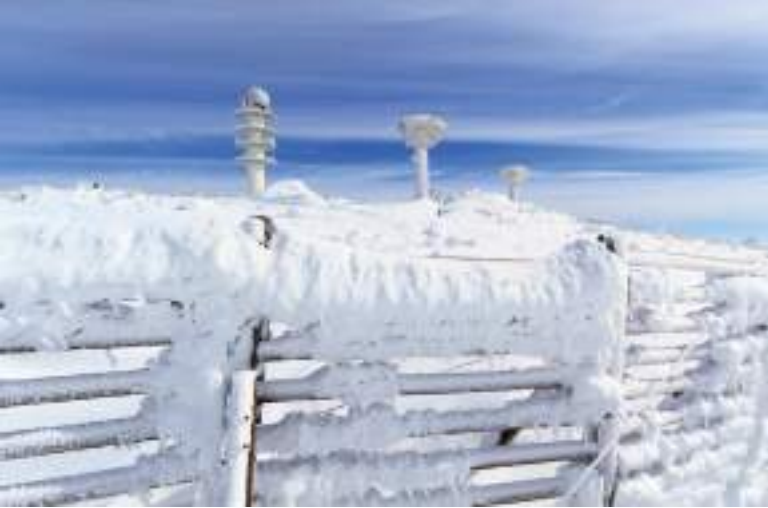
La station militaire prise dans le froid d'hiver