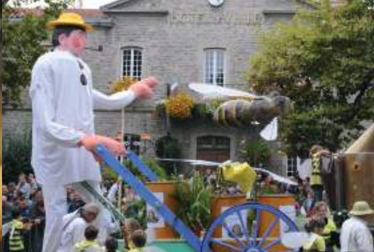
Fête de la fourme et des Côtes du Forez à Montbrison