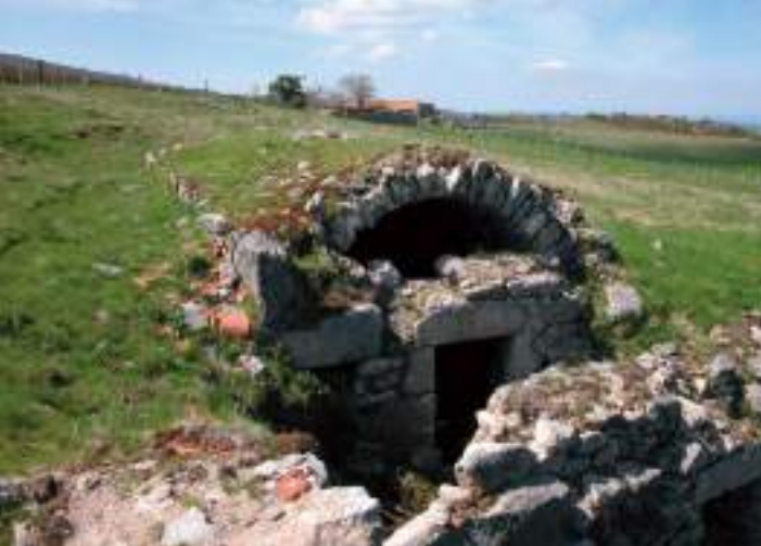
Ruines d'une cave à fourmes