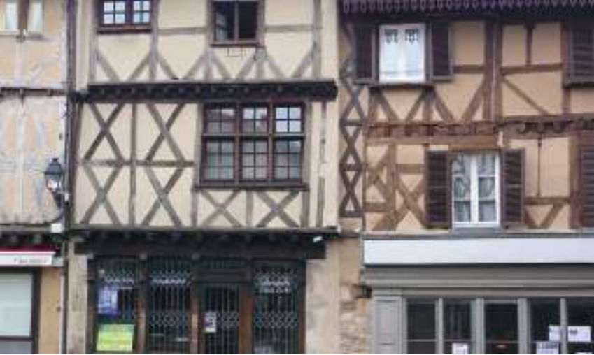
Le centre historique d'Ambert et ses maisons à pans de bois. La ville a donné son nom à la fourme auvergnate