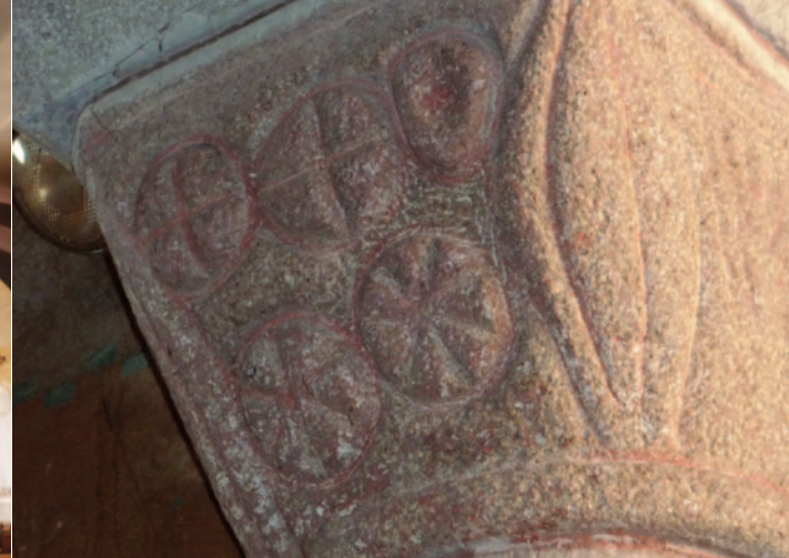
Ce chapiteau roman présente de curieux disques ornés de croix et d'étoiles, motifs que l'on retrouve au prieuré de Montverdun ainsi que dans la région du Velay