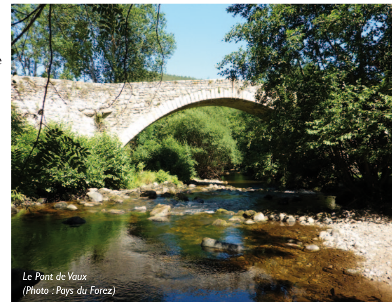
Le Pont de Vaux

Au sommet, la citadelle, défendue par une enceinte des 11e-13e siècles, est accessible par une tour-porche du 13e siècle. Cet espace renferme le donjon carré primitif du 11e siècle, une tour-donjon du 13e siècle, ainsi que les traces de l'aula seigneuriale. Visites guidées organisées en juillet et en août par la Diana. Groupes sur réservation toute l'année. Tél. : 04 77 96 01 10.