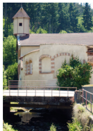
Bâtiment industriel, au lieu-dit Chez Cart

la plus connue était la source Brault, fondée en 1878. A son apogée, elle produisait plus de 7 millions de bouteilles ainsi que 500.000 bouteilles de limonade. Brault et Cie a subsisté sous diverses raisons sociales jusqu'à son rachat par Badoit avant de disparaître en 1978.