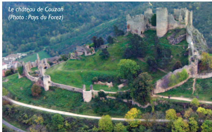
Le château de Couzan

Classé M.H. Propriété privée de la Diana. Ce château-fort est le plus vaste du département de la Loire. Il a été édifié à partir du 11e siècle par les seigneurs Damas de Couzan, branche cadette des sires de Semur. On y accède par la basse-cour protégée par une enceinte du 15e siècle flanquée de tours semi-ouvertes.