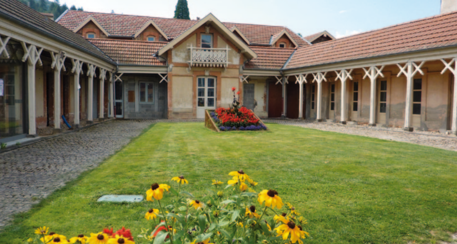
Les thermes ont été conçues selon une esthétique inspirée de l'architecture antique, largement réinterprétée.