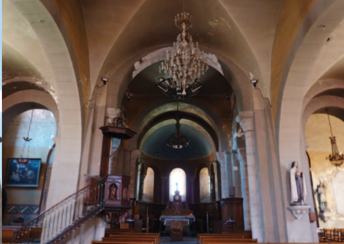
Vue générale de l'intérieur de l'église