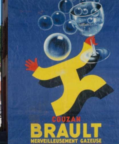
Affiche publicitaire pour la source Brault. Collection particulière (reproduction par E. Dessert, 2002)