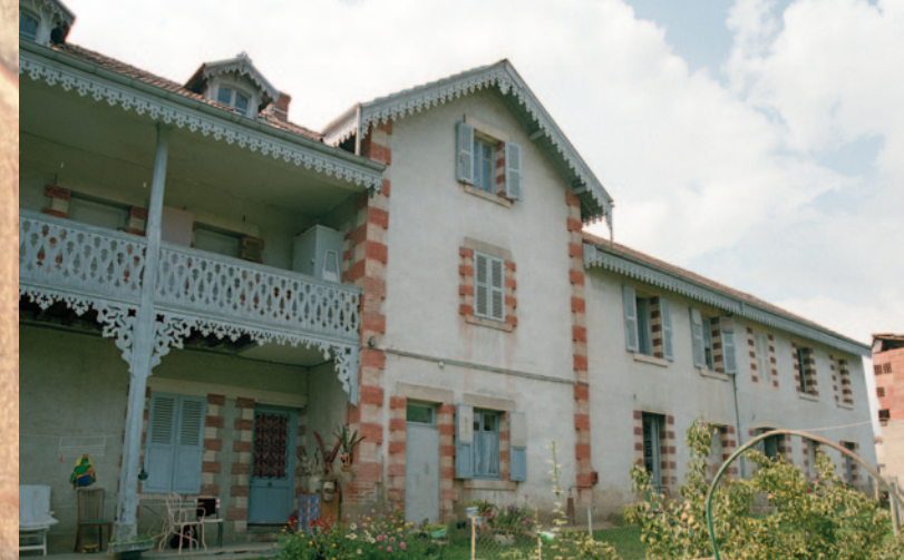
L'hôtel des Roches a été construit en 1870, en plusieurs phases. Ce vaste bâtiment à galerie donnant sur une terrasse et un jardin comprenait un restaurant ainsi qu'un jeu de boules.