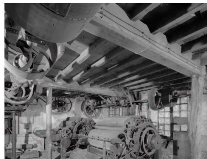
Salle des machines de la carderie Bérard

(Premier bâtiment à gauche après avoir franchi le pont de Marency). La carderie Bérard est l'un des premiers établissements industriels de Sail. Elle existait en 1848 et appartenait à Tachon et Messonnier. Elle est reprise en 1879 par Rémi Bérard qui la modernise en y ajoutant une turbine de 14 CV, en l'équipant de métiers à filer et à tisser les couvertures. En 1920, ses descendants, afin de s'assurer une source d'énergie supplémentaire, achètent le moulin Durrys à la Société des Forces motrices du Lignon et de la Loire. L'activité