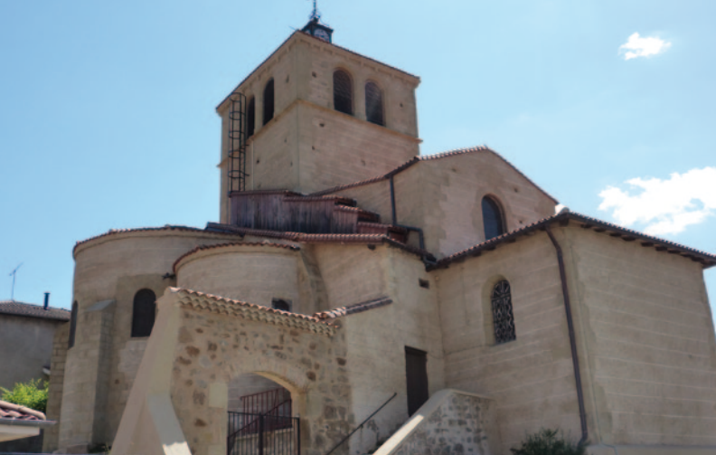
L'église de Sail-sous-Couzan. La vue côté nord permet d'apprécier le chevet roman.