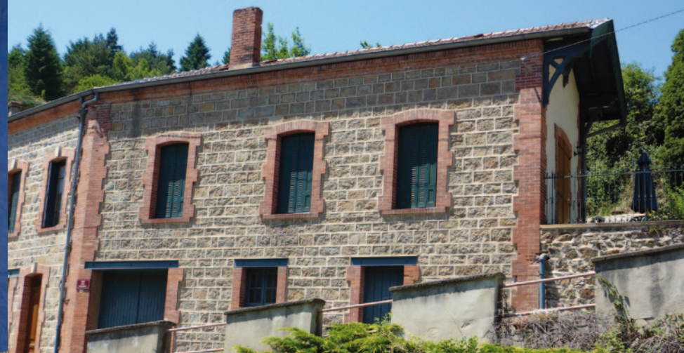
Maison de contremaître construite en pierre de taille, visible sur la route de Saint-Just-en-Bas