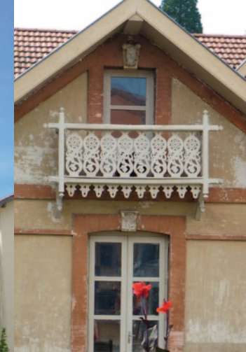
L'architecture originale des Thermes