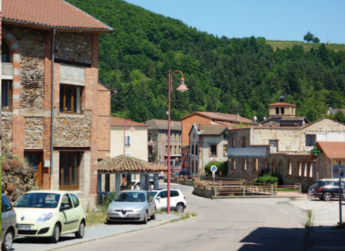
Le quartier des sources.