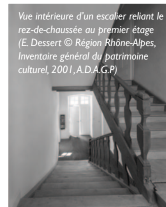
Vue intérieure d'un escalier reliant le rez-de-chaussée au premier étage

comtesses reçoivent beaucoup plus qu'elles ne sortent. Salons et salles à manger servent à accueillir les visiteurs selon les codes de mondanité et bienséances d'usages. Les repas sont pris en privé et non collectivement. Au quotidien, l'intimité est privilégiée par l'utilisation de cabinets et de chambres particulières dans lesquelles toute à chacune peut se retirer à loisir, en dehors des obligations religieuse et administrative liées à la vie du chapitre. Une hostellerie, située au-dessus du chapitre à l'est, est réservée aux visiteurs (membres de la famille) pour des séjours courts. Un portier ferme l'accès au chapitre de dix heure du soir jusqu'au lever du soleil afin d'en assurer la sécurité.