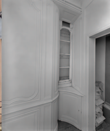
Maison de Mme Gayardon de Fenôil. Vue partielle d'un petit cabinet du rez-de-chaussée