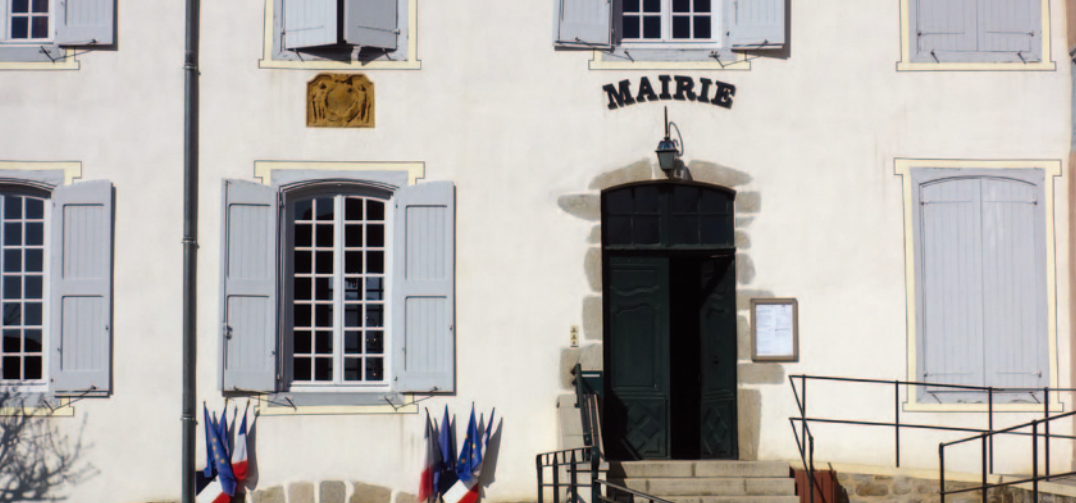
La maison de Madeleine Gayardon de Fenôil (mairie actuelle). Cette maison, construite entre 1760 et 1763 au-dessus du passage donnant accès à la place du chapitre, est la plus vaste. Les armes sculptées au-dessus de la porte arborent la croix fleurdéliée de chanoinesse-comtesse