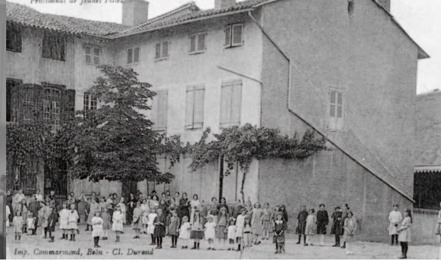
Pensionnat de jeunes filles, carte postale 1ere moitié 20e siècle. (Carte postale. Imprimerie Commarmond, Boën, première moitié du 20e siècle)