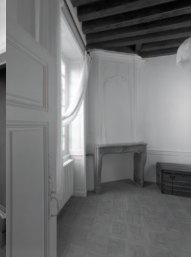
Maison de Mme Gayardon de Fenôil. Vue d'ensemble du cabinet du 1er étage