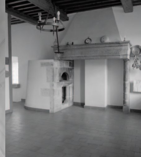
Maison de Madame d'Oizon. Vue intérieure de la cuisine