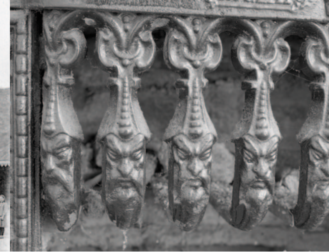
Maison de Mme de Grézolles : détail de la cheminée en fonte de la première chambre du rez-de-chaussée