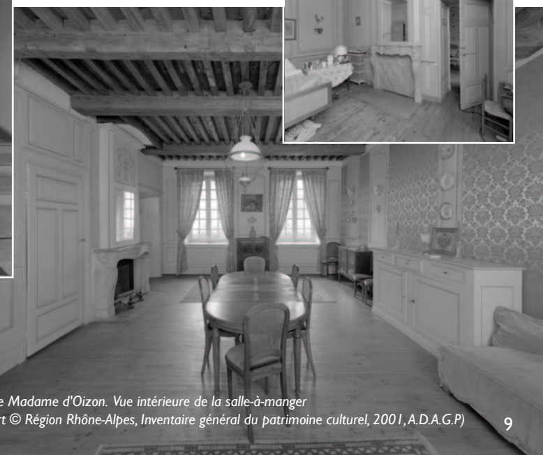
Maison de Madame d'Oizon. Vue intérieure de la salle-à-manger