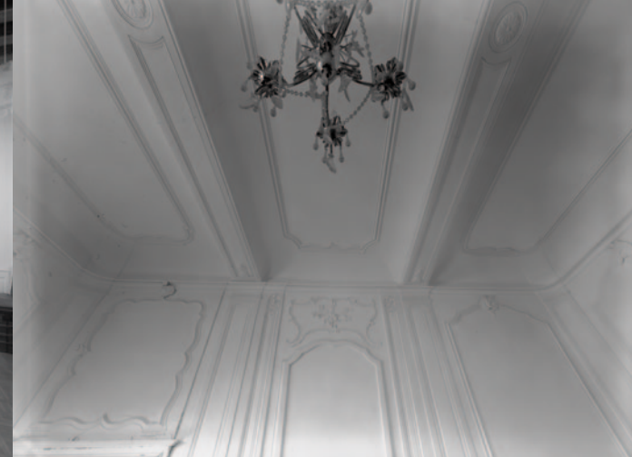
Maison de Mme Gayardon de Fenôil. Détails de lambris et du plafond de la première chambre du rez-de-chaussée