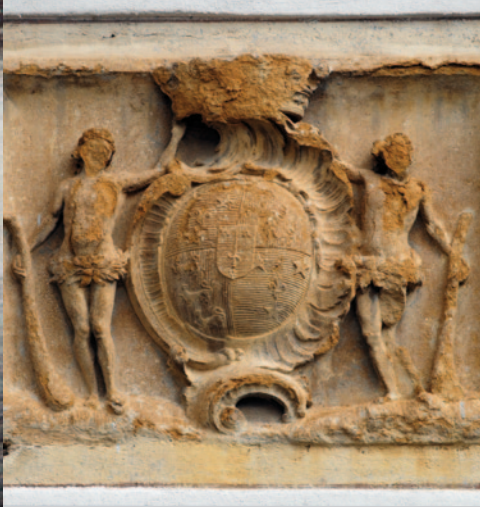
Blason visible sur une maison canoniale à droite de la mairie. Il est surmonté de la couronne comtale et encadré de deux sauvages