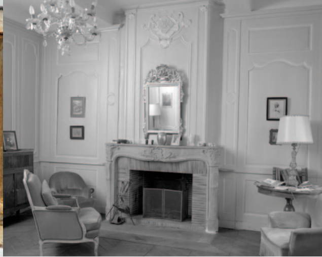
Maison de Mme d'Oizon - Vue intérieure du salon