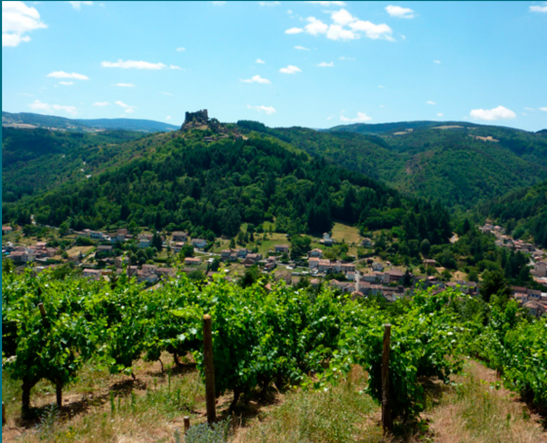
Château et village de Sail-sous-Couzan vus depuis le hameau des Junchuns.